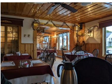
RESTAURANT LE PRESTIGE