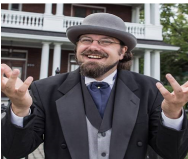
BAPTISTE LE CONTEUR

En 1980, charmés par la beauté paisible des paysages, Yves Gagnon et Diane Mackay décident de s'installer en bordure de la rivière Maskinongé sur une terre où se dressait une vieille grange qu'ils ont transformée au fil du temps en une habitation originale et pittoresque, merveilleusement intégrée au milieu environnant. Ils ont conçu et aménagé des jardins écologiques d'une grande beauté, tantôt de facture anglaise, tantôt de facture orientale. On y trouve aujourd'hui des arbres majestueux, un mariage de fruits, de légumes, de plantes aromatiques et médicinales, des plans d'eau foisonnants de vie, des suites de jardins empreints de biodiversité et d'équilibre qui créent des perspectives dramatiques et des tableaux éloquents.